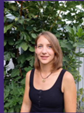
© SHV Steyr-Land DGKP Dagmar Brandstetter