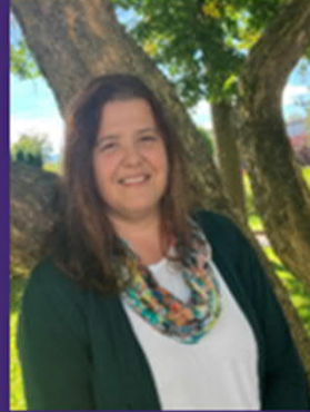
© SHV Steyr-Land DGKP Edeltraud Singer